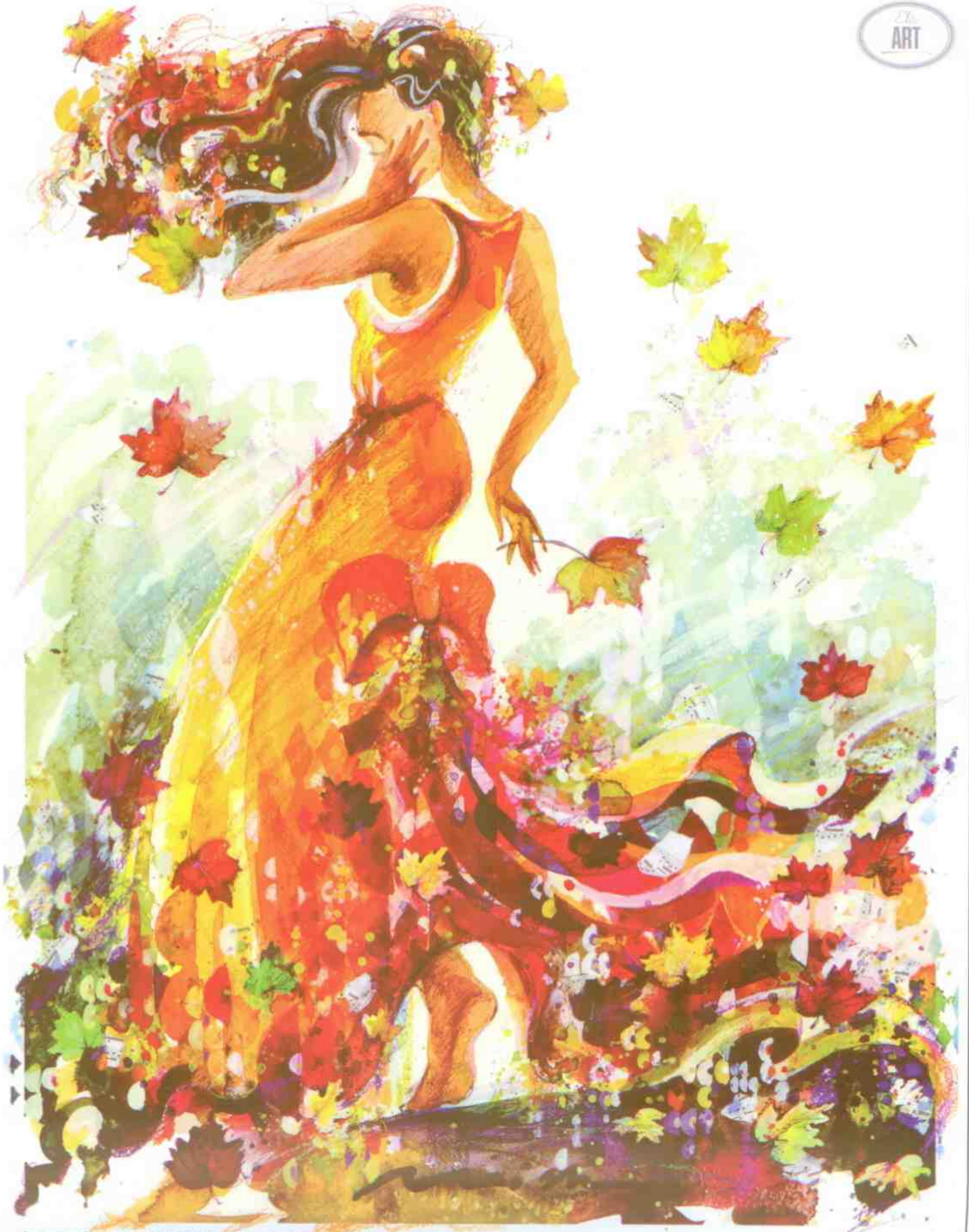
Autumn Beauty