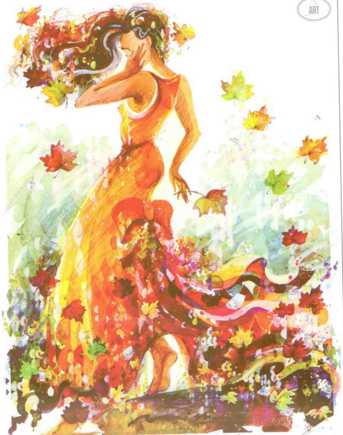
Autumn Beauty © 2005 Misha Design Studio. All Rights Reserved.